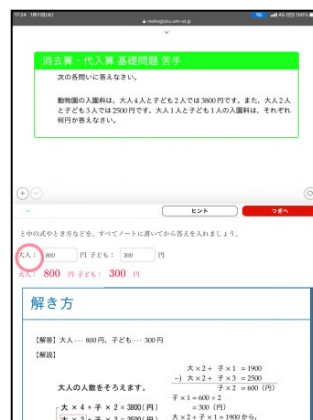
③ 苦手問題の類題を反復演習