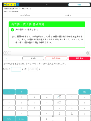
① 単元ごとに問題演習

これまで、トライアルとして一部教室にて試用した結果を踏まえ、株式会社メイツと共に改善を重ねて参りました。