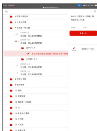
② 正答状況により苦手を特定